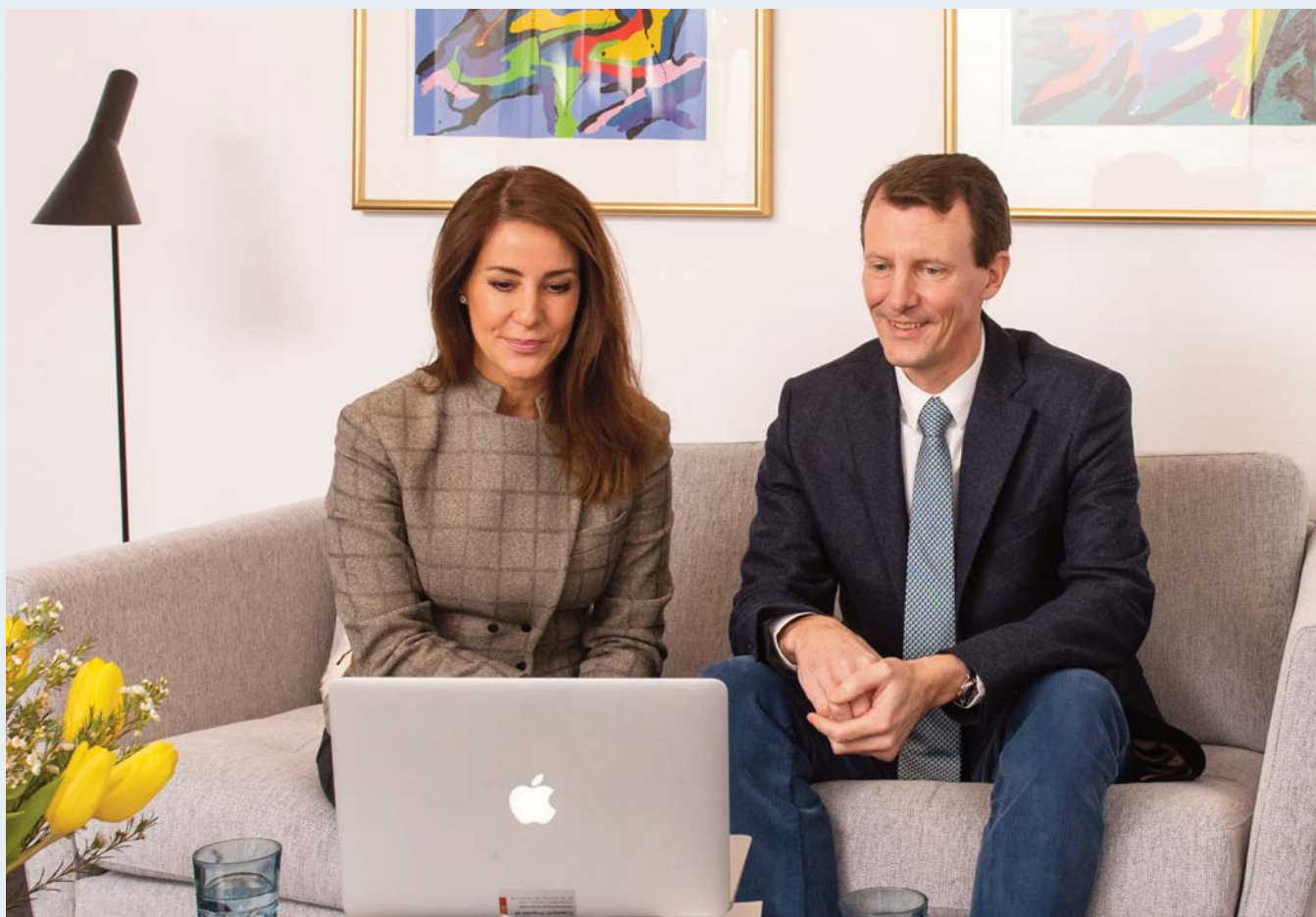
Prins Joachim er i dag kommet sig helt efter sit stroke og er for længst påbegyndt sit arbejde ved Den Danske Ambassade i Paris.

Den 24. juli 2020 var en varm dag i det centrale Sydfrankrig. For Prins Joachim og Prinsesse Marie havde det været en dag som så mange andre i deres sommerferie. Prinsen havde samme eftermiddag givet et interview til den franske avis La Dépêche du Midi , som blandt andet handlede om parrets tilknytning til regionen Le Lot og Cahors. Senere betegnede journalisten interviewet som afslappet og behageligt, og hen under aftenen tog parret sammen med deres to børn, Prins Henrik og Prinsesse Athena, til selskab hos Prins Joachims franske kusine.