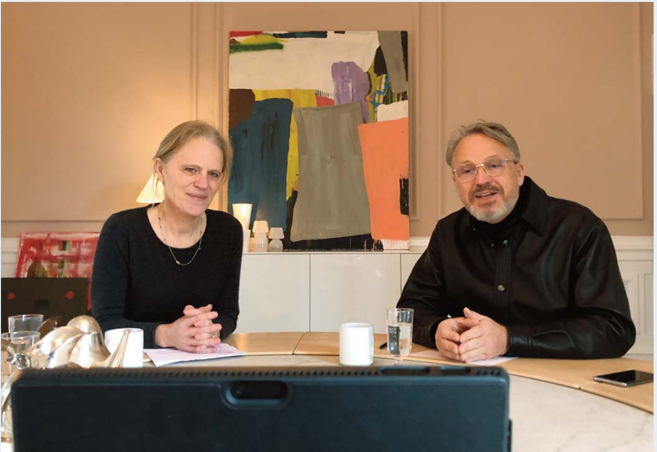
Interviewet blev afviklet på Zoom mellem Hjernesagens landsformand, direktør og journalist i København og Prinsen og Prinsessen i Paris.

”Jeg kan intet mærke. Når du har tænkt en sætning, så har du allerede hørt den formuleret inde i dig selv, og derfor forekommer den klar og tydelig. Så jeg bliver forbløffet over, at hun beder mig gentage. Da jeg ser over på Marie, kan jeg af hendes udtryk godt se, at noget er galt. Men jeg kan intet mærke”, siger Prins Joachim og slår ud med armene.